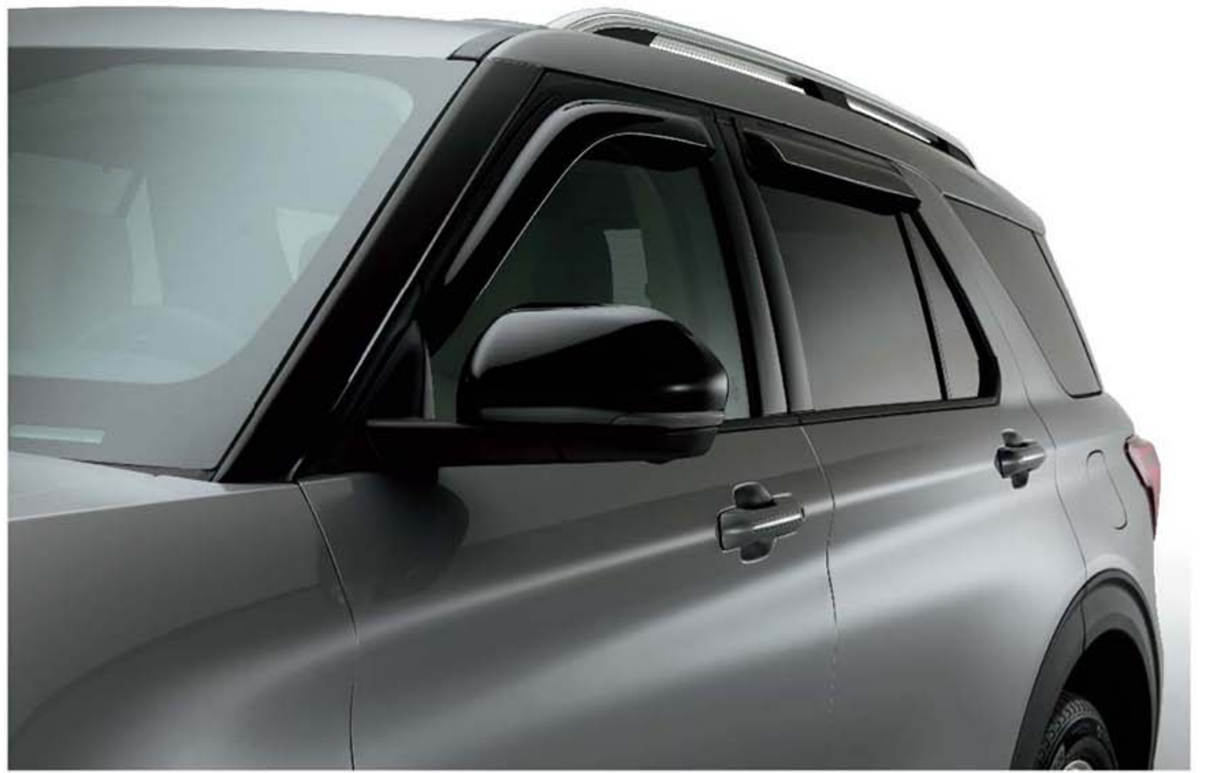
Vè che mưa cho ô tô - màu khói