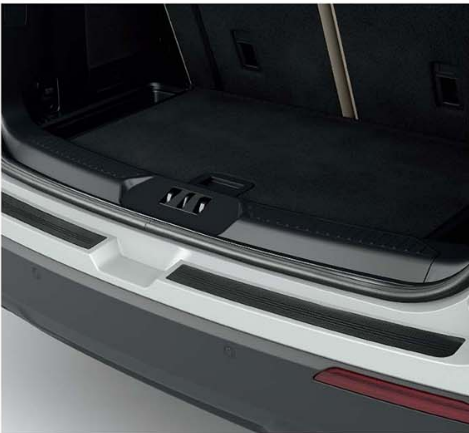
Ốp cốp sau