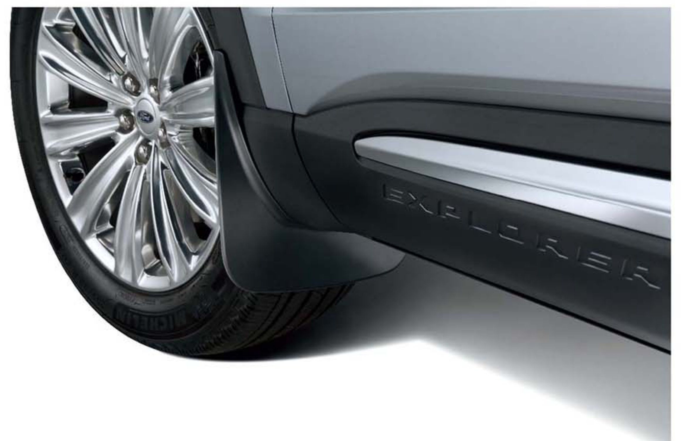
Ốp chắn bùn trước không có logo