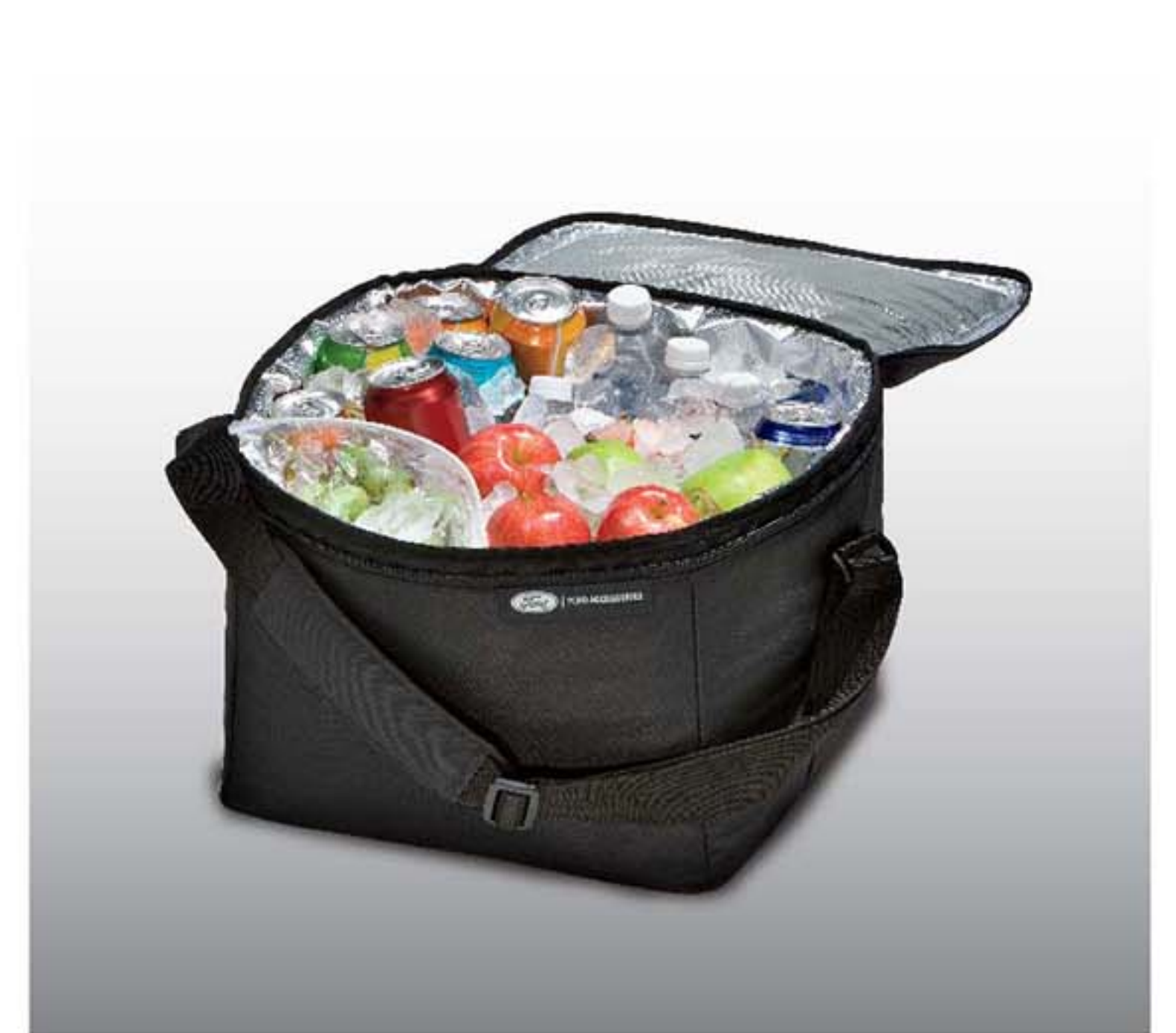
Hộp đựng đồ tích hợp có làm lạnh