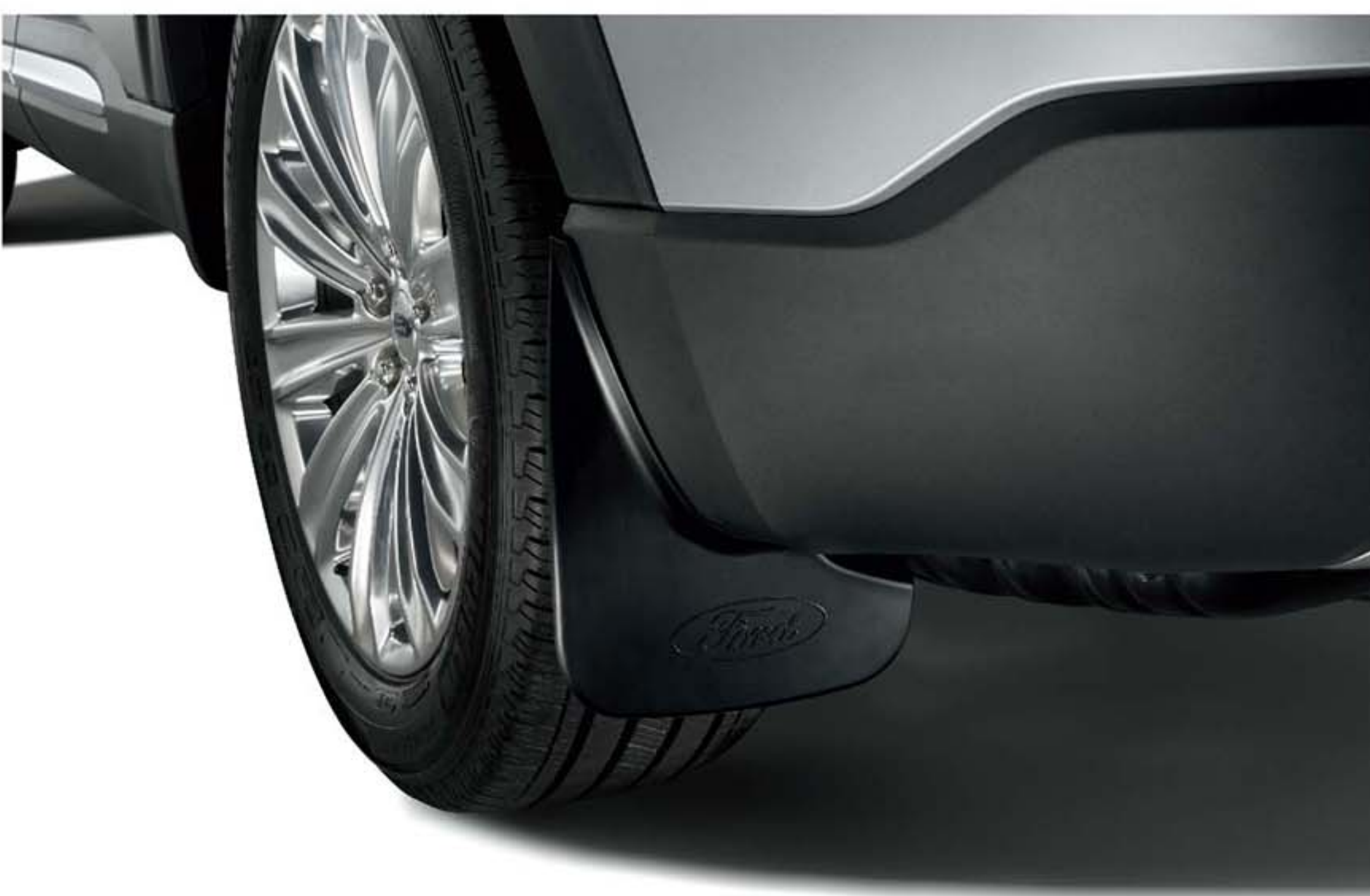
Ốp chắn bùn sau có Logo Ford