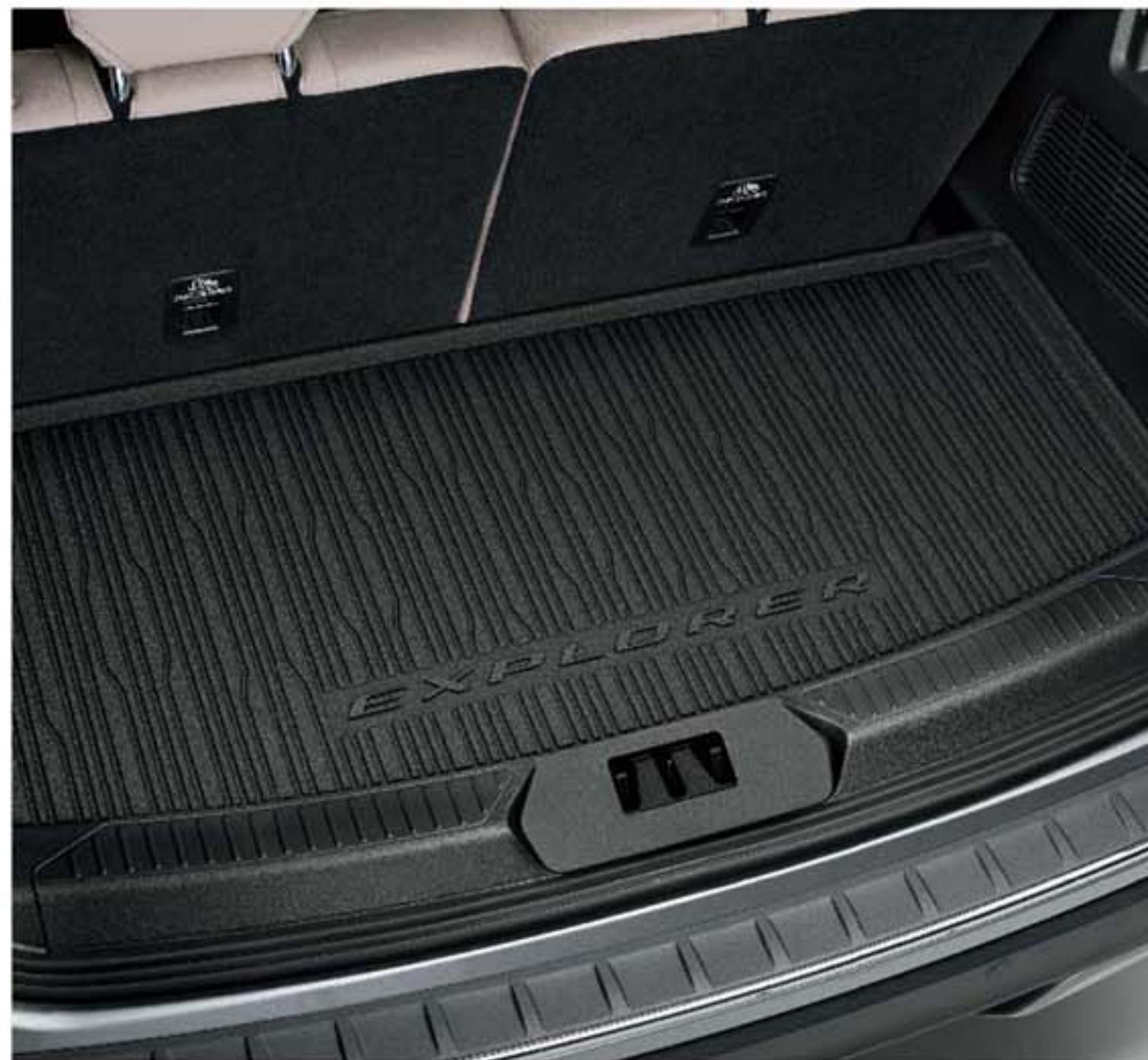
Tấm lót cao su khoảng hành lý