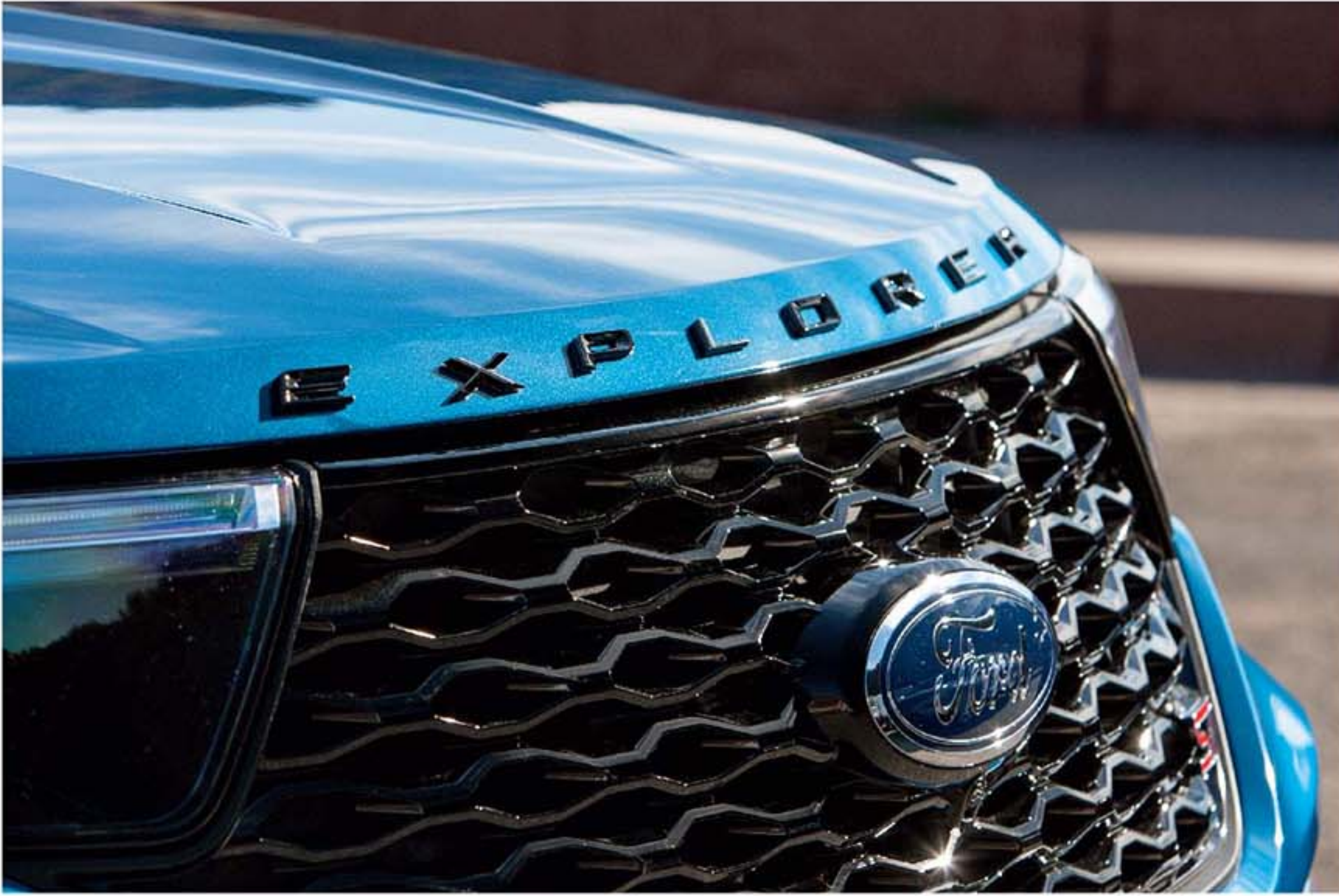
Chữ Explorer trên nắp capo